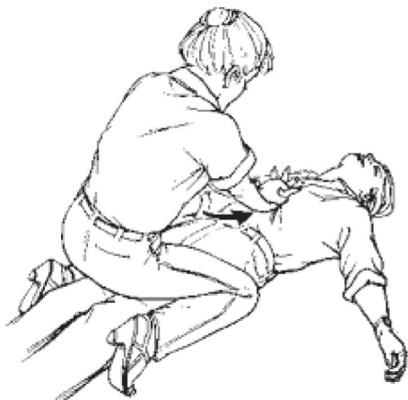
СЛИКА 1 Постапка во легната состојба кај лице при свест кое се задушува 31