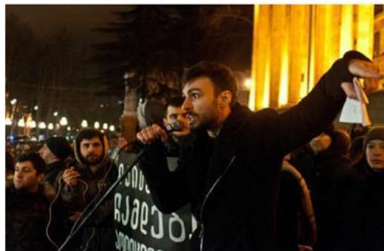
January 26: protest action "All for one".

Decriminalising drugs has become a central demand of Georgian political parties, but the fight for decriminalisation has divided Georgian society. RU